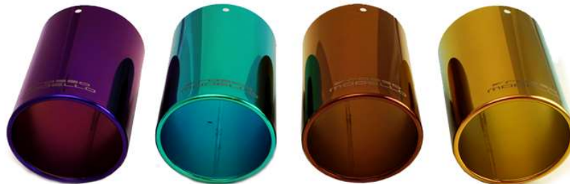
ブルーベリーパープル